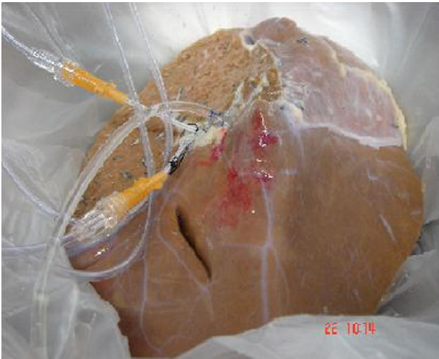
Figura 1 – Obtención de hepatocitos a partir de un split.

las suspensiones celulares y finalmente su implante en el receptor. Tras el aislamiento, las células pueden congelarse y almacenarse para infundirse posteriormente.